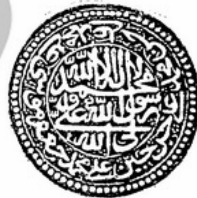
تصویر شماره (۲)