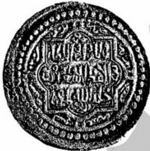
تصویر شماره (۱)